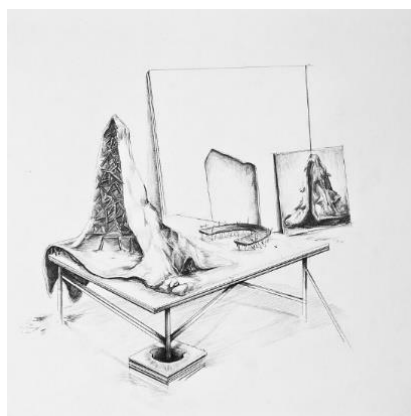
David Coste, Laboratoire des prophétie dessin N°29 , graphite sur papier 240g, 35x35, 2013, collection Frac Occitanie.