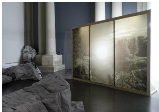
David Coste, Vue de l'exposition Soubassement Centre d'art la Chapelle ST Jacques, 2014