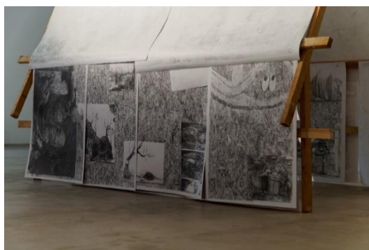
Vue d'exposition MAGCP exposition Lieux dits , 2018