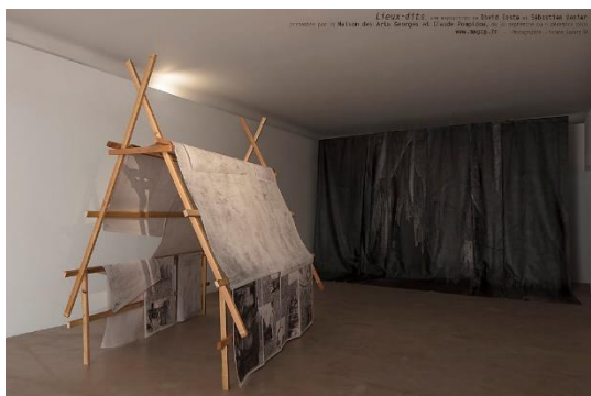
David Coste, Installation, Shelter N°1 , 2018 Dessin graphite sur papier 300g, structure en bois.