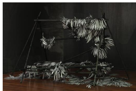
Vue de l'exposition Une montagne(s) à l'artothèque