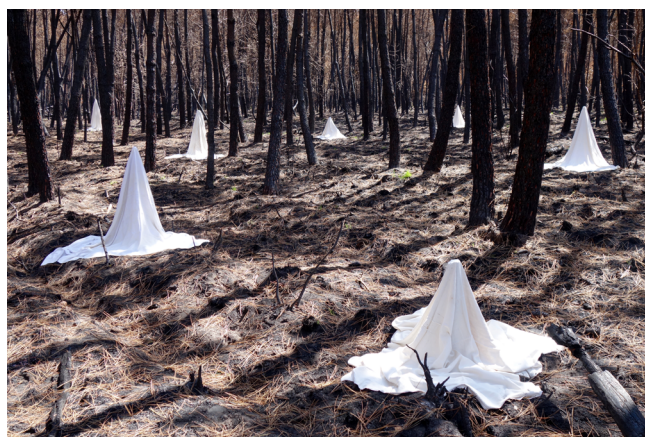
«Smoking Area», 2015

Dans la grande salle d'exposition, une seule photographie est accrochée au mur ; un cliché intitulé «Smoking area» convoque sans doute le plus directement les fantômes. Laurent Lacotte effectue sa prise de vue au milieu d'un paysage calciné de cinq cent quatre-vingts hectares, quelques heures à peine après le passage des flammes. Dans cette zone dévastée se trouve une maison abandonnée. C'est de celle-ci que proviennent les draps en lin déposés sur des souches brûlées au cœur du foyer incendiaire. Ce qu'il reste de la forêt et de ceux qui la hantent : longs drapés blancs conformes à la représentation classique du fantôme telle qu'apparue au XIII ème siècle – le drap étant le linceul dans lequel était enterré le défunt.