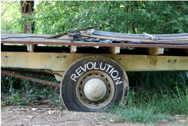
«Révolution», 2021 Peinture aérosol sur pneu de remorque agricole crevé. Eymet. Tirage pigmentaire contrecollé sur dibond, 90 x 60 cm, caisse en bois.