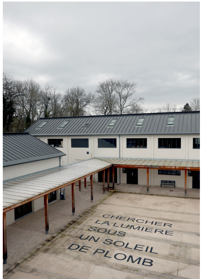
«Chercher la lumière sous un soleil de plomb», 2023 Peinture écologique sur béton et granit. Parvis du Centre d'art les Tanneries, Amilly.