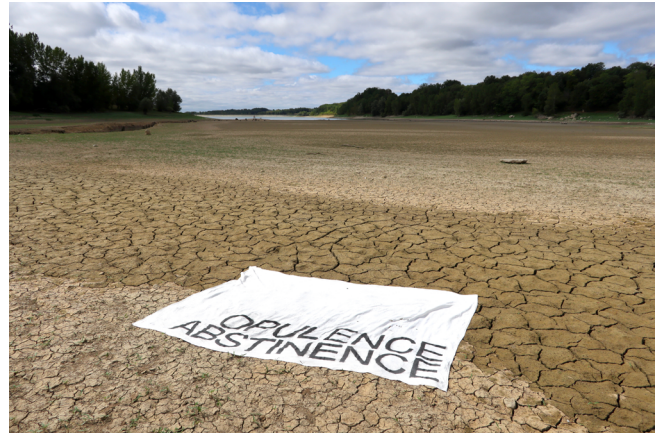
«Opulence Abstinence», 2022 Charbon sur drap de lin. Lac de l'Escourou, Soumensac. Tirage pigmentaire contrecollé sur dibond, 90 x 60 cm, caisse en bois.