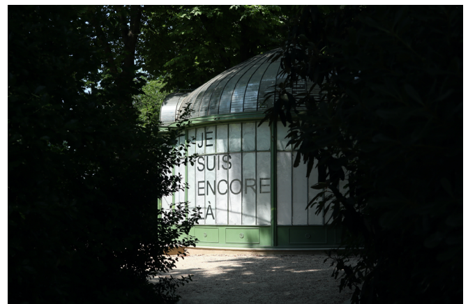
«Je suis encore là», 2021 Blanc de Meudon et farine sur plexiglass. Kiosque du square des Batignolles, Paris. bois.